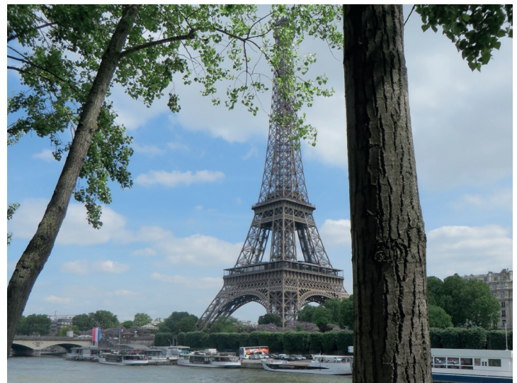
Vue de la Tour Eiffel - Paris