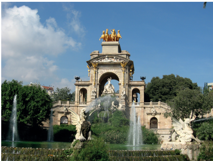
Parc de la Ciutadella - Barcelone